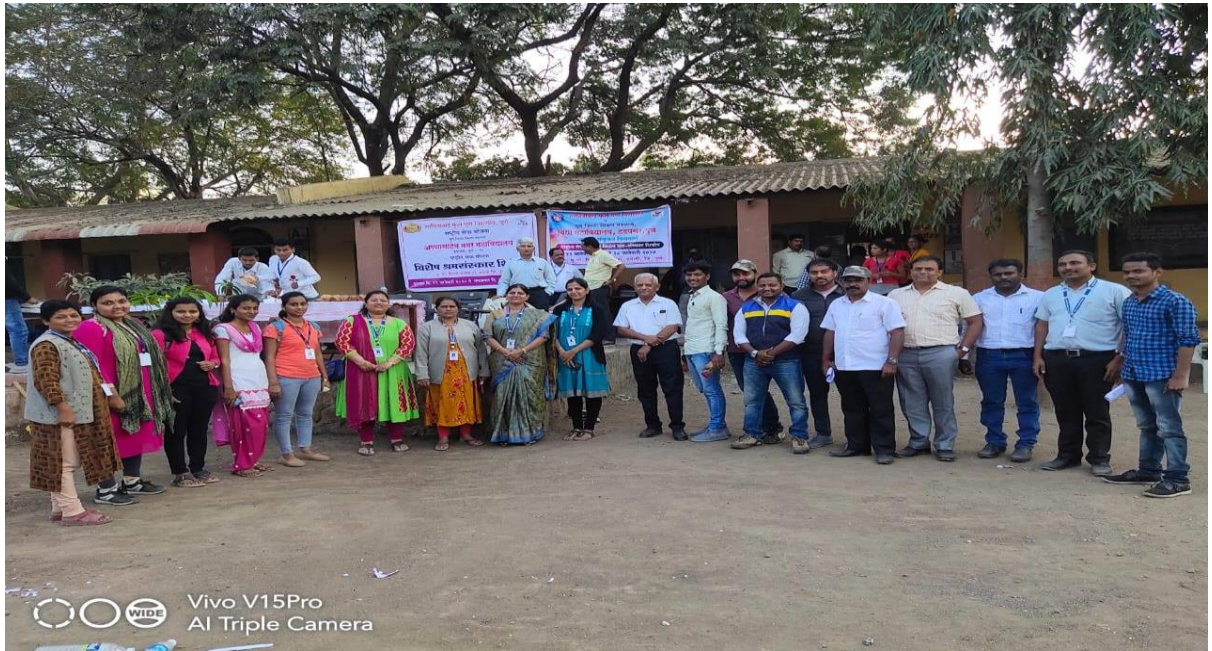
Vivo V15Pro AI Triple Camera